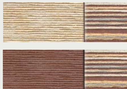
Die Polsterstoff-Varianten „Esprit“ hell und „Esprit“ dunkel. Wie soll er aussehen, Ihr neuer MAXIMO?

Individualisten haben besondere Ansprüche an ihren MAXIMO. Extras, wie zum Beispiel die ausfahrbare Trittstufe, sind gegen Aufpreis möglich.